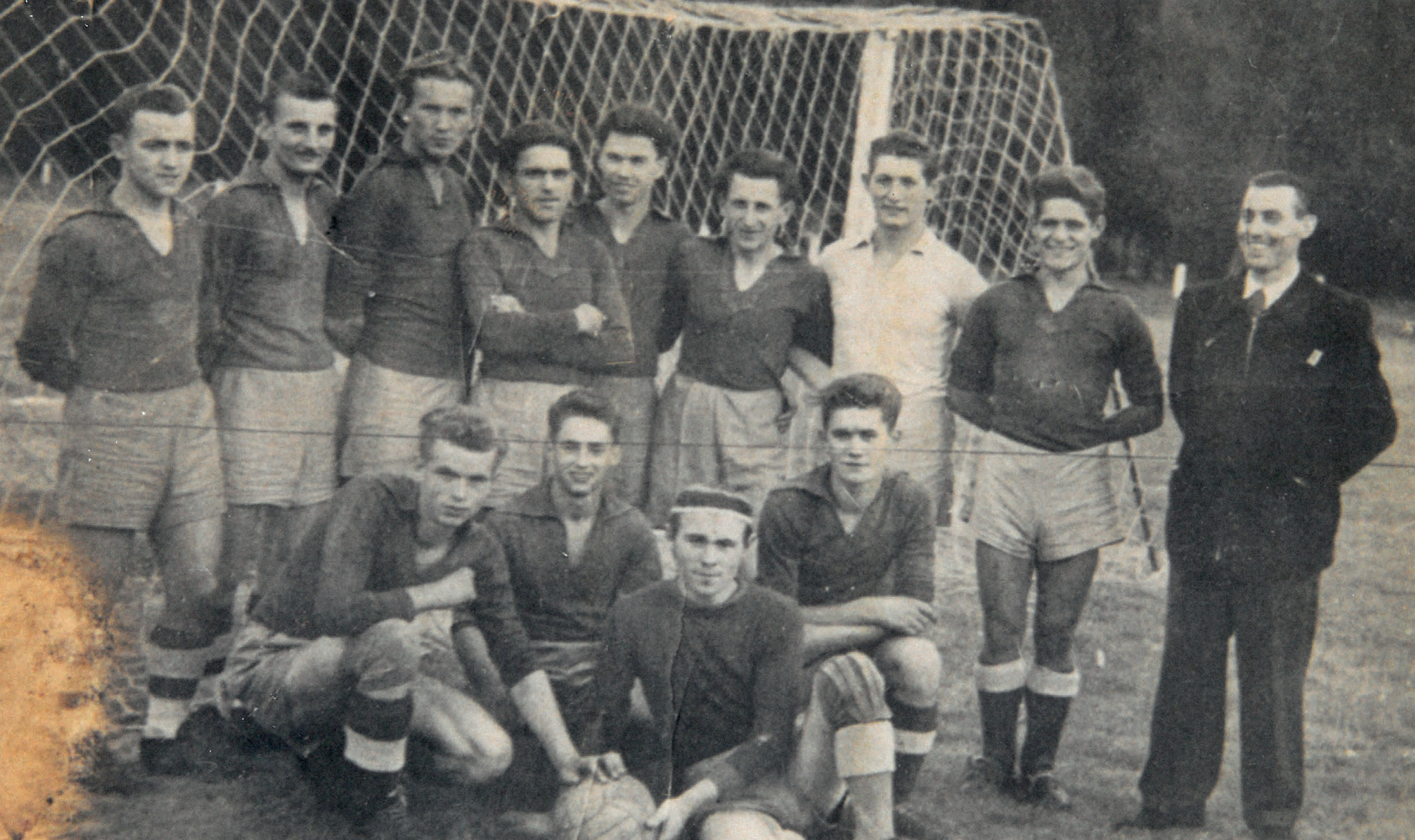
„UNIA” Iłowa 1955 r.