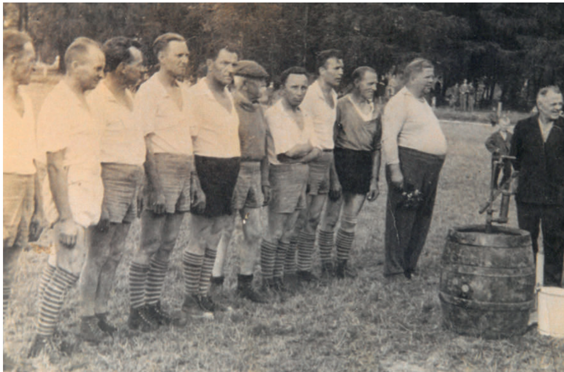
Mecz o beczkę piwa 1958 r.